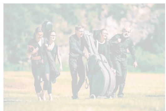
Im Anmarsch: Die Franzlins da Tschlin treten im Rahmen des Flims-Festivals am 21. Juli in der Eventhalle in Flims auf.

Tickets an den Gästeinformationen von Flims, Laax, Falera, in jedem Bahnhof und jeder Post, unter www.starticket.ch , per Mail unter info@flimsfestival.ch und unter Tel. 081 911 0636. Alle Details zum Programm unter flimsfestival.ch .