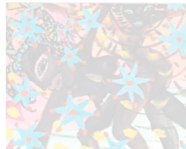
Claude Sandoz zeigt in Luzern karibische Impressionen.