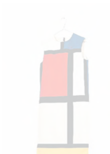
500 Jahre Modegeschichte im Kunsthaus Zürich.