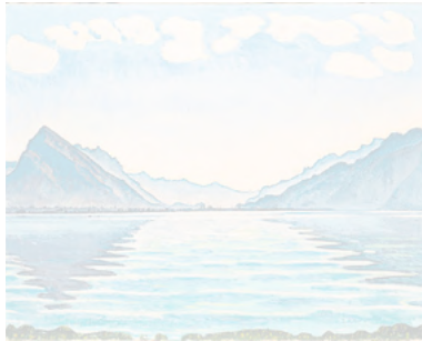
Ferdinand Hodlers Thunersee von 1905 ist in Genf und Bern zu sehen.