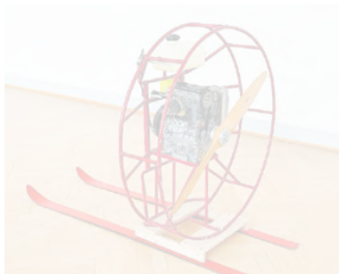
Roman Signers Skulptur «Propeller mit Motor» ist im Kunstmuseum St. Gallen zu sehen.