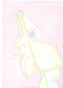
Maria Lassnig hat Ausstellungen in St. Gallen und Basel.