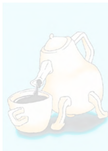
Urs Fischer in der grafischen Sammlung der ETH.